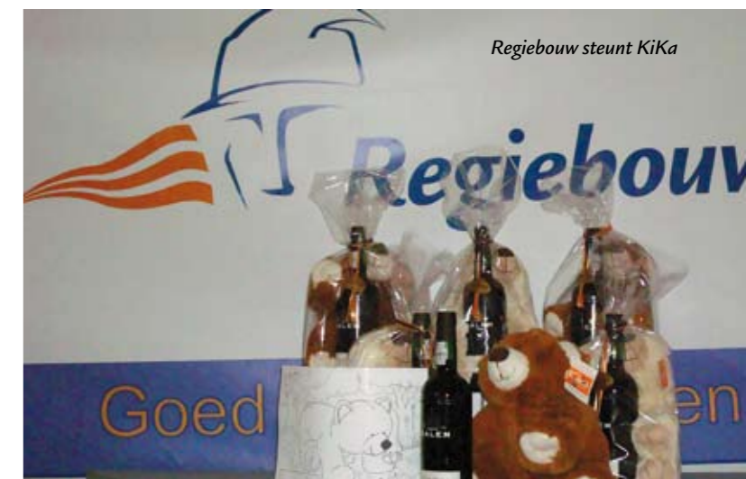
Regiebouw steunt KiKa