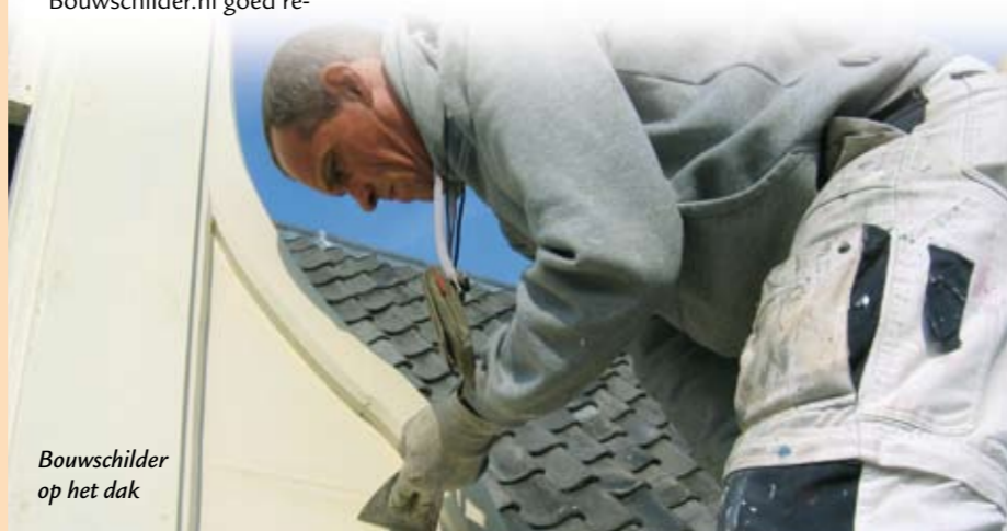
Bouwschilder op het dak

Bouwschilder.nl blijft ook in 2010 een stabiele factor als het gaat om de flexibele inzet van schilders. Meer informatie op www.bouwschilder.nl of bel Thomas Wassenaar, 06 41 61 50 17.